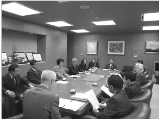
党区議団の区長への申し入れ＝3月15日

の改善、簡易ベッドなど避難所の防災資器材の充実、全ての分譲マンションと1万の区内事業所の震災時の対応調査などです。