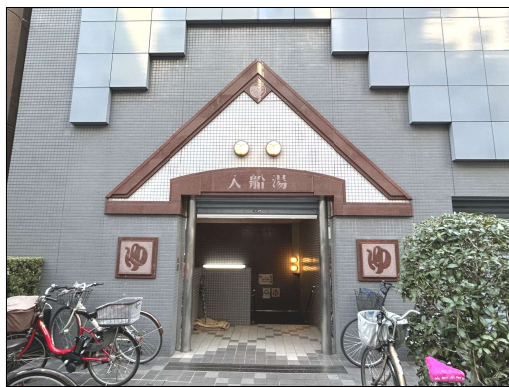
入船3丁目の「入船湯」

報告によると、昨年10月、ビル所有者から、ビル建て替へのため現行の賃貸借契約を終了したいと申入れがあり、入船湯継続のために協議を重ねたが、契約更新の合意に至らず、契約期間で満了日である来年2025