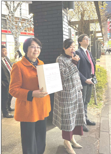
中央区議会各会派共同で、能登半島地震の被災地救援募金に取り組みました=1月21日、数寄屋橋交差点

能登半島地震をふまえた防災対 策の強化として、 ●感震ブレイカー無償配布が予算 化(予算額5900万円)されま