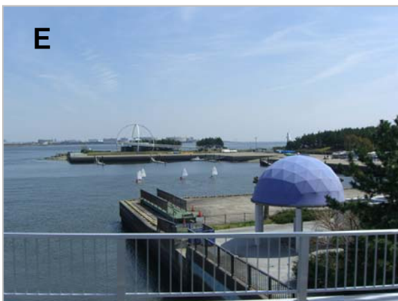
E 若洲にヨットハーバー(左写真)があるにもかかわらず、若洲公園先端の岩場(右)にあらたにヨットハーバーを作るムダ