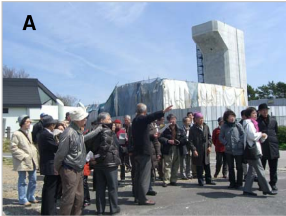
A 臨海道路(第2湾岸)の橋脚工事現場(若洲公園内で)