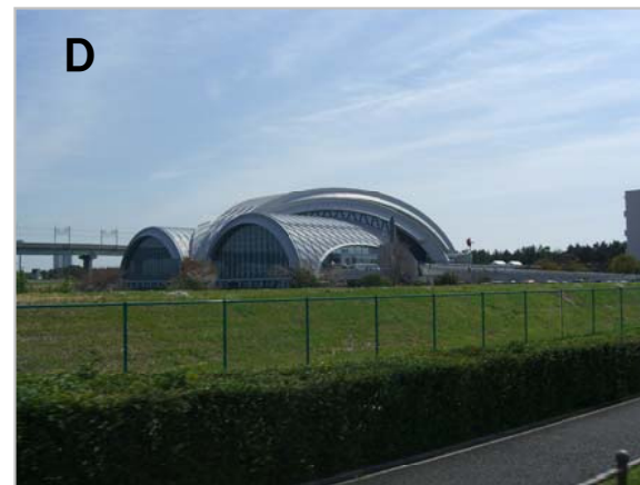
D 辰巳国際水泳場を使わずに、近くに水泳場を作るムダ