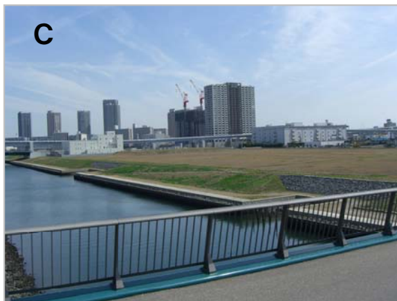
C 埋め立てられた有明16万坪。オリンピック選手村予定地

臨海部民連主催の第6回「都市再生・臨海部開発 現地見学バスツアー」が、3月29日におこなわ