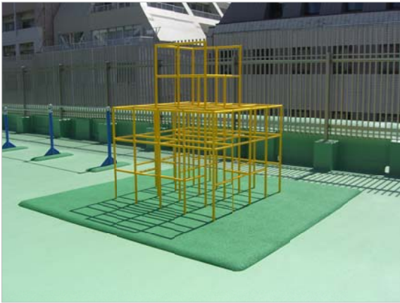
ジャングルジム。落ちててもケガしないようにクッションも

園庭は屋上となるため、土の感触がなく、ケガも心配されます。部分的にも芝生があれば…。