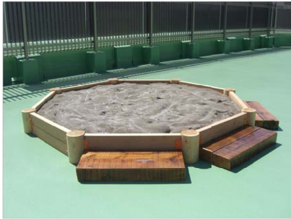
砂場の囲いに段差があるので、夢中になると転がるかも