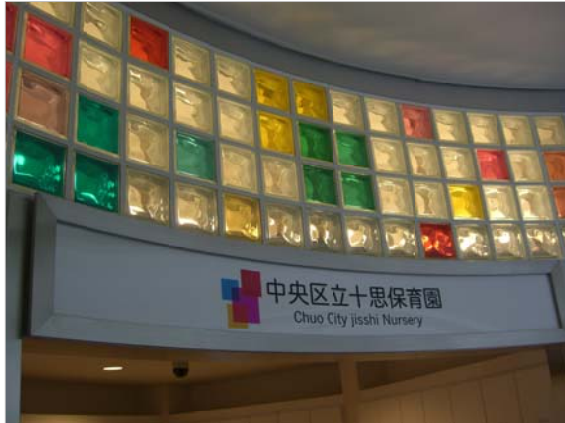
入り口には、色とりどりのステンドグラス風の工夫が