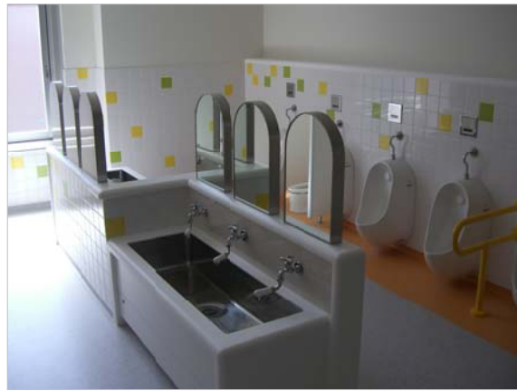
トイレの鏡もアーチ型