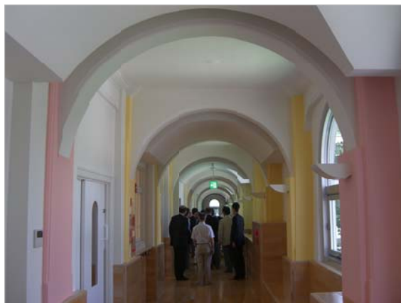
廊下の奥までアーチが続きます。