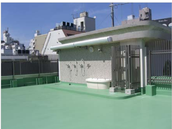
シャワーの設備。この前にプールを組み立てます

十思保育園の定員は、85人。中央区では、認可保育園（区立保育園）への入園を待っている子