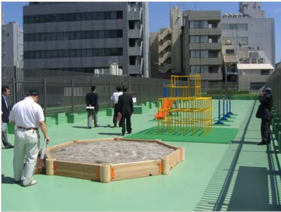
ビルに囲まれた園庭ですが、日は良く当たります