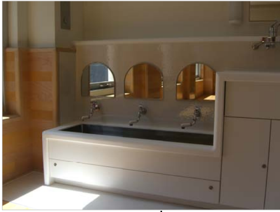
部屋にある洗面所の鏡もアーチ型に