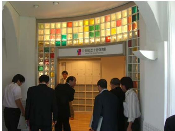
3階エレベータのすぐ前が、保育園の入り口です

地下鉄「小伝馬町」駅近くの旧十思小学校。現在、十思スクエアとして利用されています。