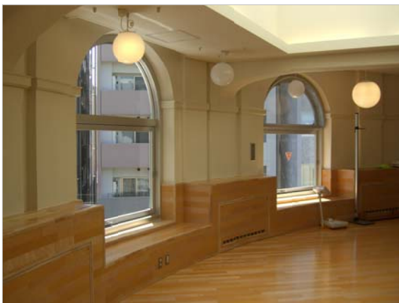
アーチ型の窓は、そのまま活かされています

地下鉄「小伝馬町」駅近くの旧十思小学校。現在、十思スクエアとして利用されています。