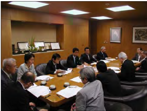
区長（右側）に「インフルエンザワクチンの無料化」などを求めた予算要望の申し入れ =9/29

日本共産党区議団は、区に「新型インフルエンザワクチン接種の公的負担」を求めています。ついに、国が定めた優先的にワクチン接種をする方を対象に、全額助成を行うことになりました。 23区で全額助成するのは、今のところ中央区と港区だけです。 【全額助成の対象となる方】 妊娠中の方、基礎疾患を有する方、及び、入院患者など重症の方 （詳しくは、かかりつけ医、または健康推進課へご相談ください）