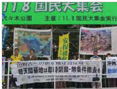
日本から米軍基地をなくそう！