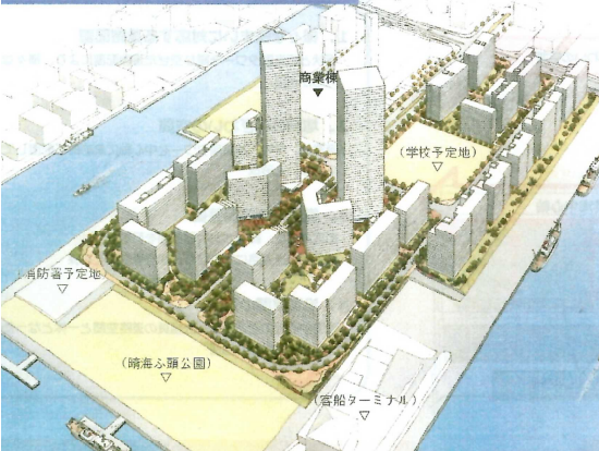
選手村イメージ図