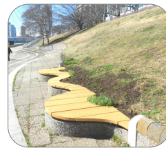
のモデルプラン (大会終了後イメージ)