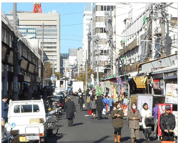
ガラガラの場外市場波除通り=2018. 12. 18. 9時半頃

日本共産党区議団は、築地市場移転の影響について、11月13日、17日、12月14日に、築地六、七丁目と場外市場を全戸訪問し、聞き取り調査を行いました。今号では場外市場の声を紹介します。