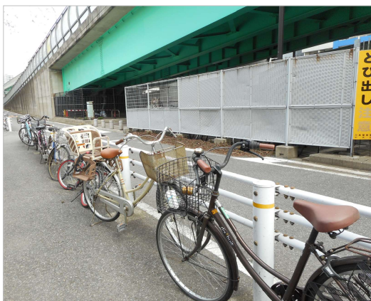
月島駅前第一駐輪場の月島側入り口付近