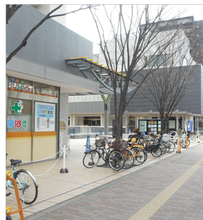
開店前のスーパー入り口付近

丁目地下（28・9%）、月島駅前第一（32・7%）、浜町公園下（40・6%）の4カ所です。